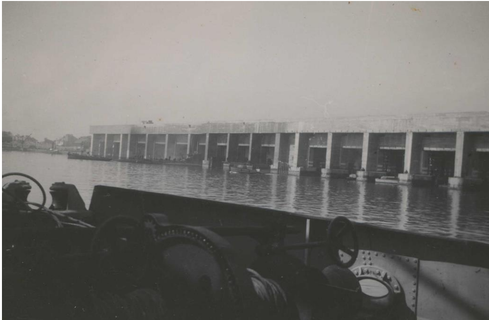
Base sous-marine allemande de Saint-Nazaire.

Cote : 2NUM/8 – Fonds Robert Morice, enfant de Saint-Nazaire-Archives de Saint-Nazaire.