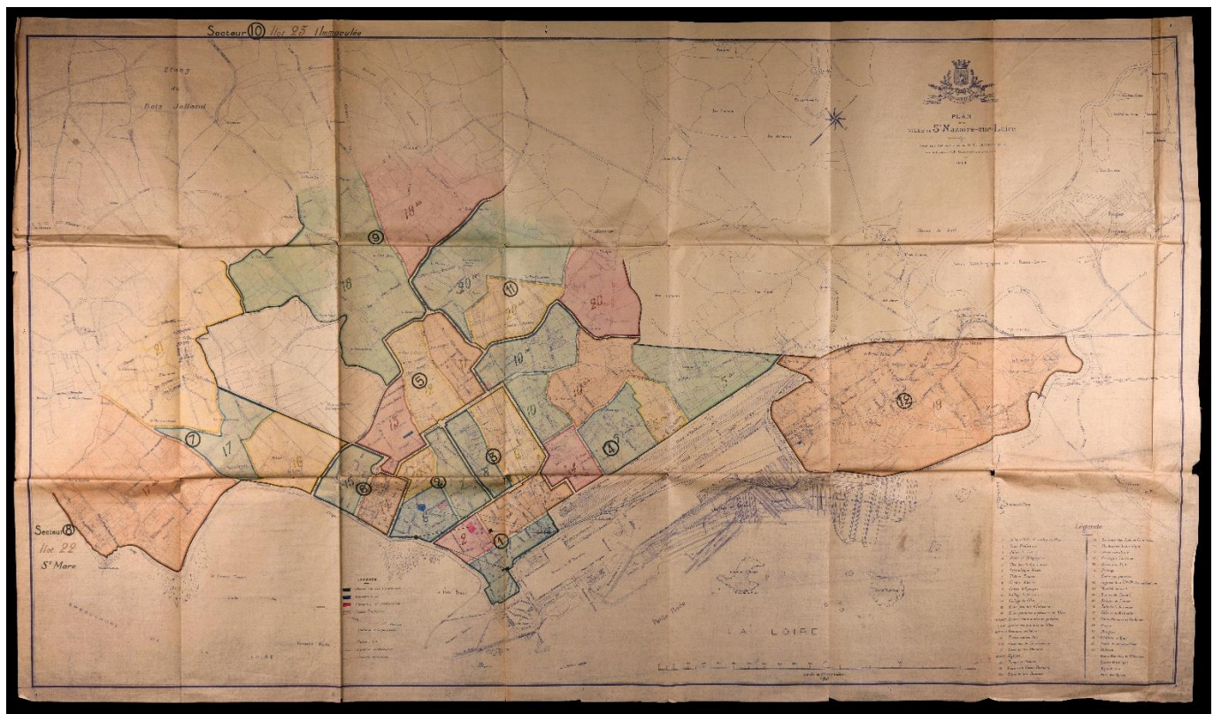
Organisation par secteurs de la Défense passive à Saint-Nazaire à partir du plan de la ville de 1924. Cote : 3J/5-Fonds Campredon-Archives de Saint-Nazaire.