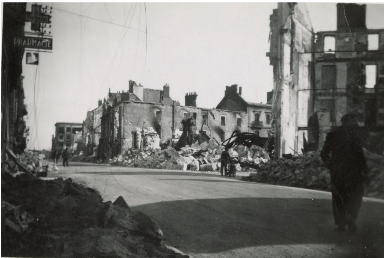
La rue de Nantes et les ruines des Nouvelles Galeries. Cote : 19Fi/16