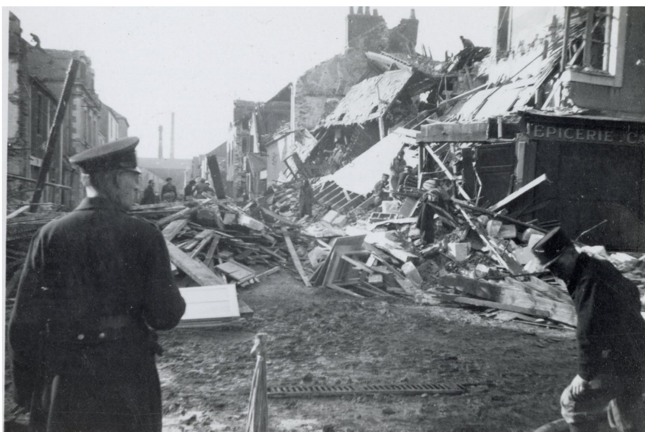
Saint-Nazaire après un bombardement (1942 ou 1943), rue des Caboteurs près de la place Marceau : photographie par Pierre Toscer, maire de la Ville de 1941 à 1945.

19Fi/32 - Fonds Toscer-Archives de Saint-Nazaire