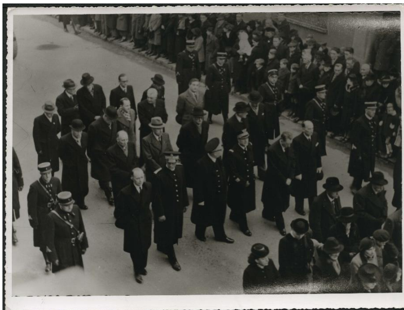
L'enterrement des apprentis : derrière les familles, de nombreuses personnalités (préfet, sous-préfet, élus municipaux) accompagnent le cortège funéraire. Cote : 12Fi/0255-Archives de Saint-Nazaire

population n'est pas habituée. Les sirènes déclenchées tardivement n'ont pas permis aux ouvriers et apprentis de se mettre à l'abri. Le bilan est de 186 morts dont 150 apprentis et 129 blessés. Les funérailles du 12 novembre sont suivies par une population en deuil. La tragédie marque définitivement la mémoire de la ville.