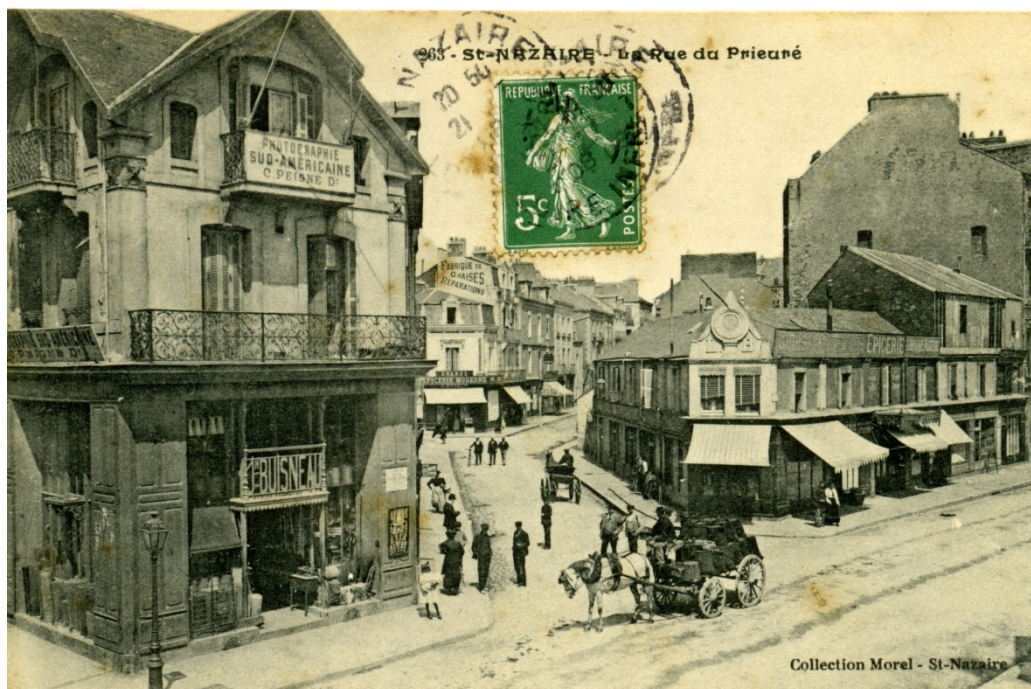
Carte postale publicitaire du photographe C. Peigné situé au-dessus de la quincaillerie Buisneau, début du XXe siècle.

La seule quincaillerie Buisneau mentionnée en 1892 est celle située à l'angle de la rue de Nantes et du Prieuré, dont l'adresse est alors 15 rue de Nantes. En 1904-1905, le Guide annuaire de Saint-Nazaire et de l'arrondissement localise cette même quincaillerie au 1 rue du Prieuré, en précisant qu'elle est tenue par Mme Veuve Buisneau.